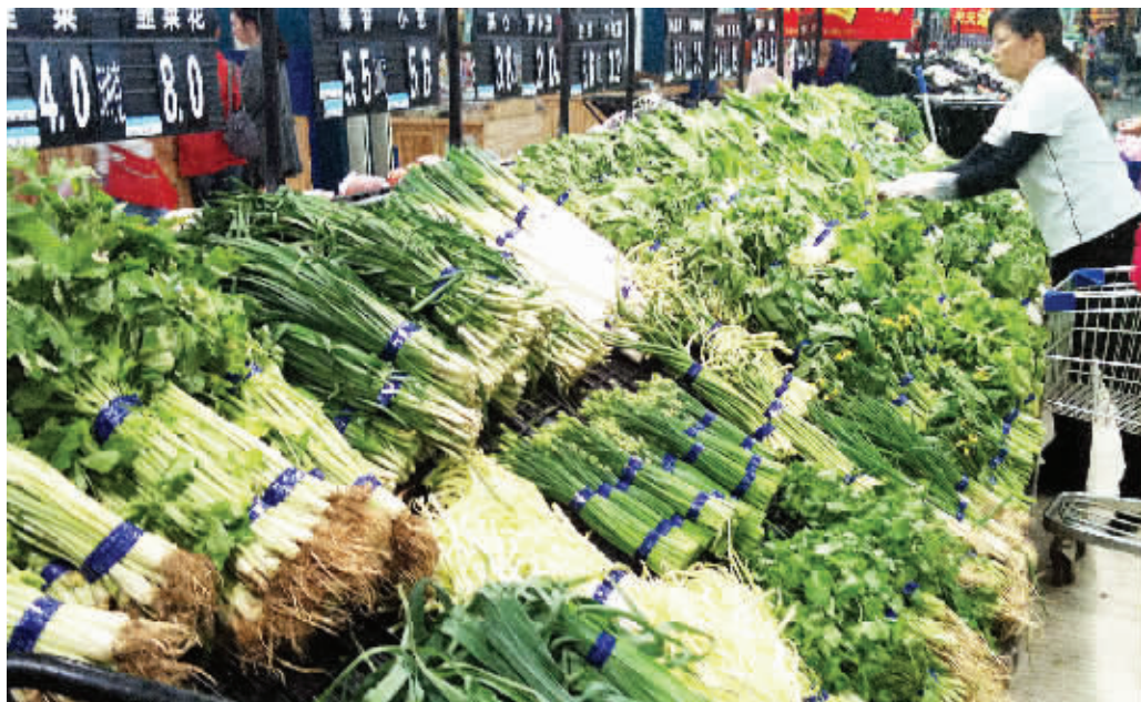
11月1日，长沙市某超市食品种类繁多，市民选购时多看多辨别。