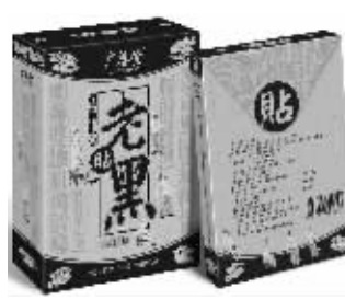
20盒一疗程 市内免费送货