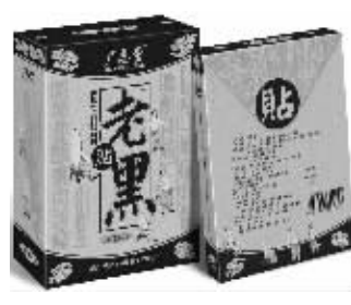
20盒一疗程 市内免费送货