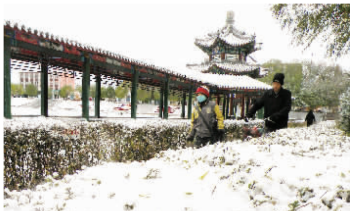
16日,黑龙江齐齐哈尔市泰来县降雪,街头银装素裹。