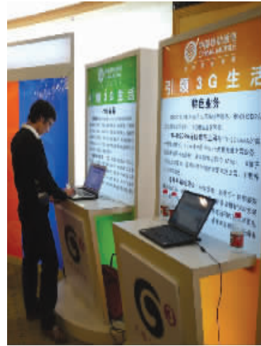
移动 G3(TD)因其中国自主研发的身份,成为国人关注的焦点。图为市民在移动营业厅体验 G3 业务。