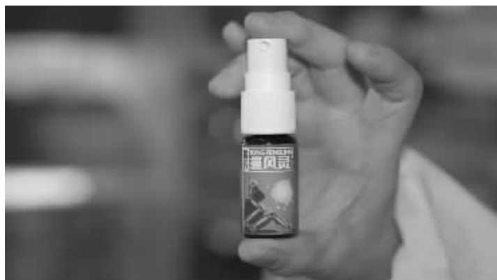
▲最新研制的痛风凝胶,不吃药治痛风获国家专利

车站阿波罗药柜、誉湘大药房、火星镇楚济堂、车站楚明堂药房、天心区:平和堂(五一店/东塘店)、南门口好又多药柜、岳麓区:河西通程新一佳药号、西站康寿大药房、开福区:东风路楚仁堂药房、星沙:旺鑫大药房、浏阳:钰华堂大药房、望城:工农大药房、株洲:贺家土健康堂大药房、湘潭:基建营福顺昌医药堂、常德: