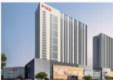
昆明万达城市综合体

万达城市综合体开一个火一个，并为区域周边及整座城市带来巨大的提升和拉动，不但维持着万达的成功经营和运作，也为政府和国家提供了数额巨大的稳定税收，且每年的税收都保持稳定的增长。如在上海、北京这种国际化大都市，上规模的万达广场，每个项目每年能为政府提供几十亿元的税收。