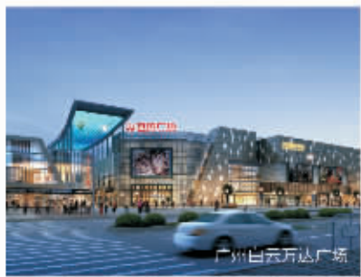
广州白云万达广场

万达每一个城市综合体的正常运作能够创造一万个左右稳定的就业岗位，在当前社会就业形势非常严峻的环境下，万达已经开业和每年十来个商业中心的开业，就相当于每年为社会新增10万余个就业岗位，帮助政府解决了大问题。