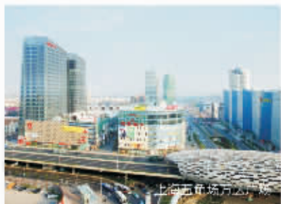
上海五角场万达广场

万达城市综合体开一个火一个，并为区域周边及整座城市带来巨大的提升和拉动，不但维持着万达的成功经营和运作，也为政府和国家提供了数额巨大的稳定税收，且每年的税收都保持稳定的增长。如在上海、北京这种国际化大都市，上规模的万达广场，每个项目每年能为政府提供几十亿元的税收。