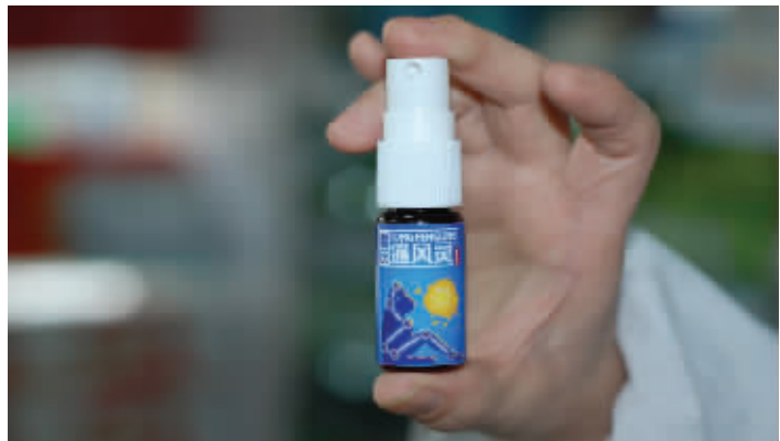
▲最新研制的痛风凝胶,不吃药治痛风获国家专利

车站阿波罗药柜、誉湘大药房、火星镇楚济堂、车站楚明堂药房、天心区:平和堂(五一店/东塘店)、南门口好又多药柜、岳麓区:河西通程新一佳药号、西站康寿大药房、开福区:东风路楚仁堂药房、星沙:旺鑫大药房、浏阳:钰华堂大药房、望城:工农大药房、株洲:贺家土健康堂大药房、湘潭:基建营福顺昌医药堂、常德: