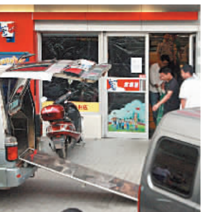
9月12日下午,长沙市东风路,殡仪馆来车运走尸体。

本报9月12日讯 下午3时,记者接到长沙市民王先生报料,东风路省博物馆对面肯德基餐厅内,有一六旬男子倒地猝死。餐厅随即贴出暂停营业公告并禁止人员进入。