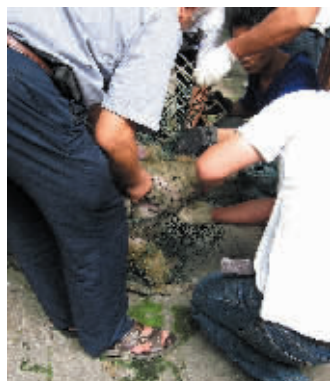
由于灵长类的动物过笼难度大,猴子们不得不接受“五花大绑”的待遇。