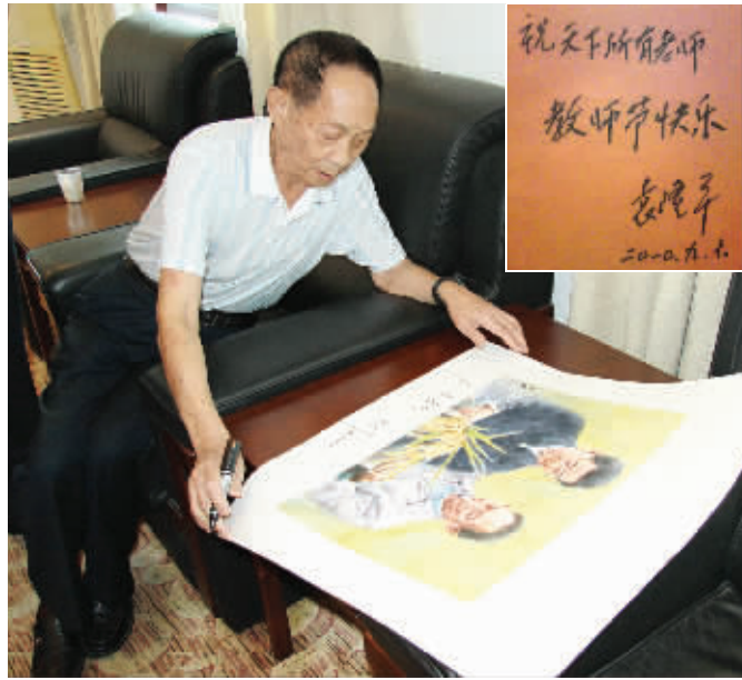
袁隆平收到黄承谦老师绘制的这幅水彩画后,非常高兴,当即题下对教师节的诚挚祝福。