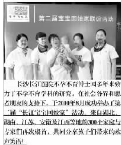
长沙长江医院不孕不育博士团多年来致力于不孕不育学科的研究,在社会各界和患者朋友的支持下,于2010年8月成功举办第二届“长江宝宝回娘家”活动,来自湖北、湖南、江苏、安徽及江西等地的300个家庭与专家们再次聚首,共同分享孩子们带来的欢声笑语!