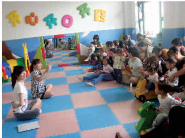
机构早教市场远未饱和。