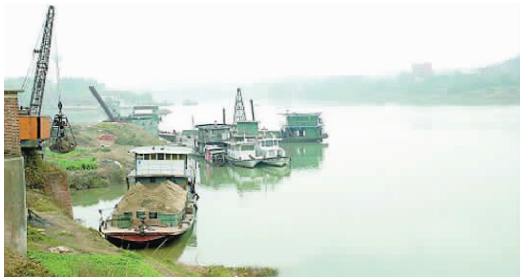
湘江河道上,挖砂船仍随处可见。(资料图片)