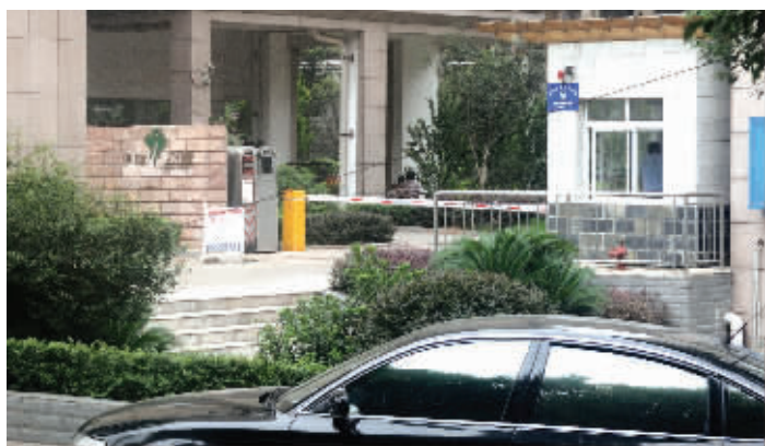
8月23日,一业主将车停在长沙市华欣公寓前。