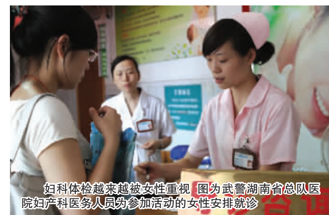
妇科体检越来越被女性重视 图为武警湖南省总队医院妇产科医务人员为参加活动的女性安排就诊

女性朋友如身体不适,请拨打热线 88883318 申请免费宫颈防癌筛查和 8 元体检