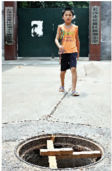
8月17日,长沙市银盆岭路裕湘小学门口,一井盖被偷,只用十字形木架遮挡。