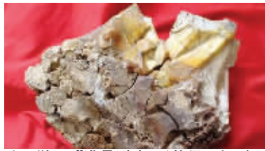
这颗“怪石”满是裂痕,形状很不规则。

这颗“怪石”究竟是啥玩艺?近日,经仔细察看,有着30多年考古经验的73岁的湘潭市博物馆原馆长谭国才表示,根据形