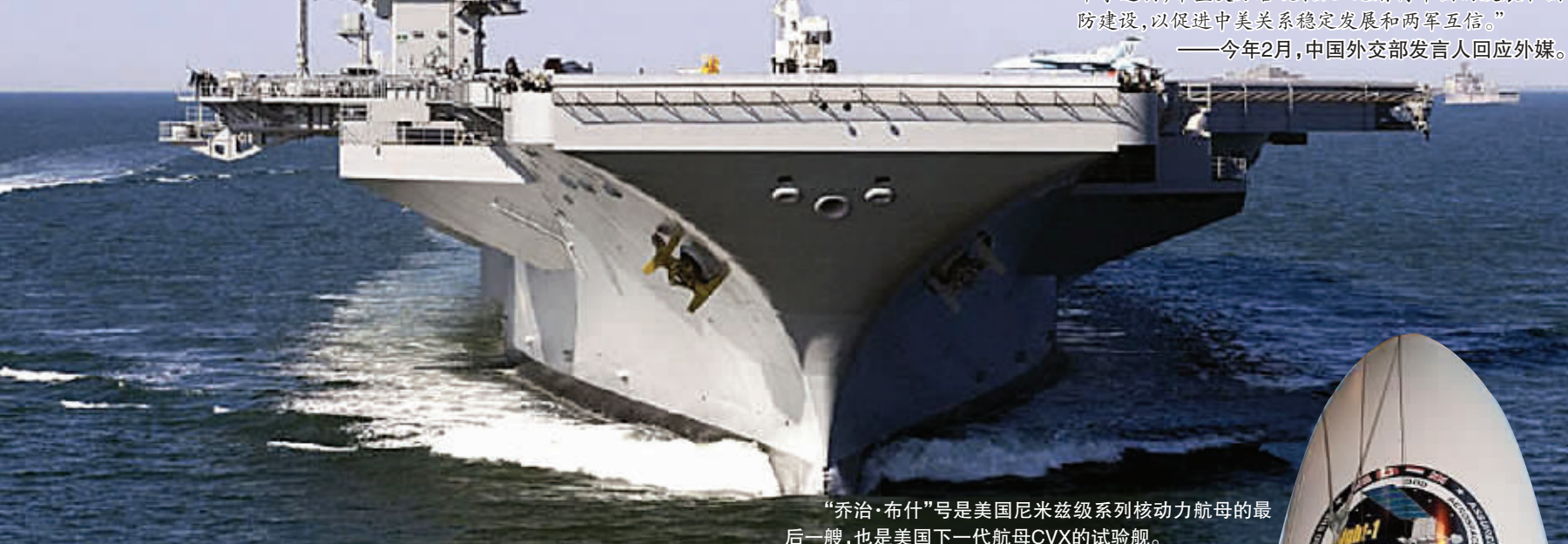
“乔治·布什”号是美国尼米兹级系列核动力航母的最后一艘，也是美国下一代航母CVX的试验舰。

美国国防部16日公布年度《与中华人民共和国有关的军事与安全发展》报告，认为中国在过去30年间取得的经济和科技进步让中国军队有能力开展全面的现代化建设。但报告同时无视中国的防御性国防政策，称中国在军队建设等问题上透明度不够。 与往年发布的《中国军力报告》不同，今年的报告改名为《与中华人民共和国有关的军事与安全发展》。