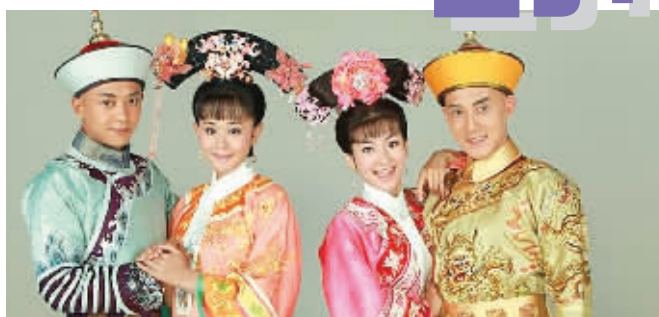
左起:尔康、紫薇、小燕子和五阿哥。