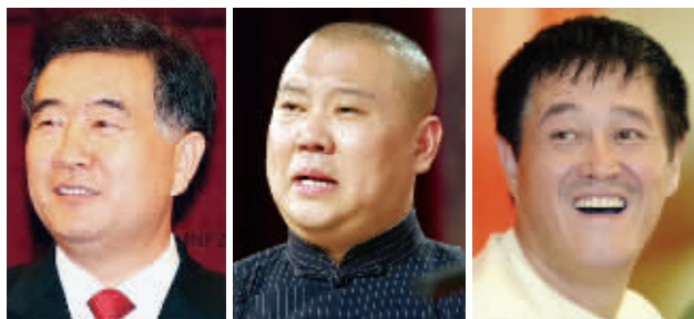
汪洋 郭德纲 赵本山

“不管什么样的网络文化,都不能挑战社会公共道德的底线,不能破坏青少年成长的环境。”