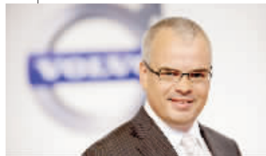
斯蒂芬·雅克布近照。