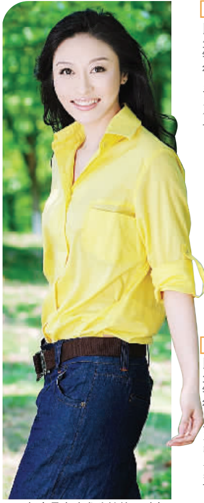
舒高是个追求稳健的理财者。