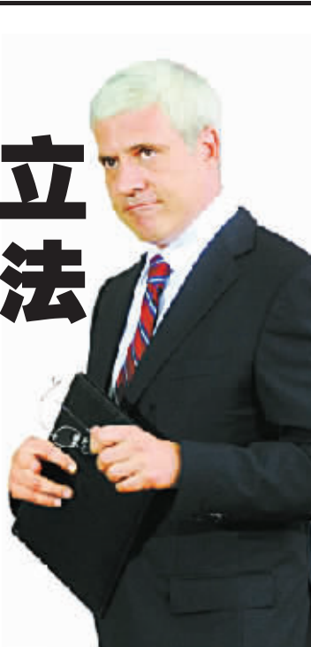
塞尔维亚总统塔迪奇一脸怒容

科索沃2008年2月单方面宣布脱离塞尔维亚共和国成为一个“独立主权国家”，在国际社会引起争议。现阶段，包括美国、部分欧盟国家在内的69个国家承认科索沃的独立地位，但俄、印等国拒绝承认科索沃独立。