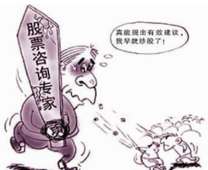
广电总局规定，证券节目不得对股票涨跌做确定性判断。

具体包括，证券节目须为播出机构自制自播，不得出租、转让时段，与咨询机构进行商业化合作；不得对具体证券或者证券相关产品的价格涨跌或者市场走势做出确定性判断，