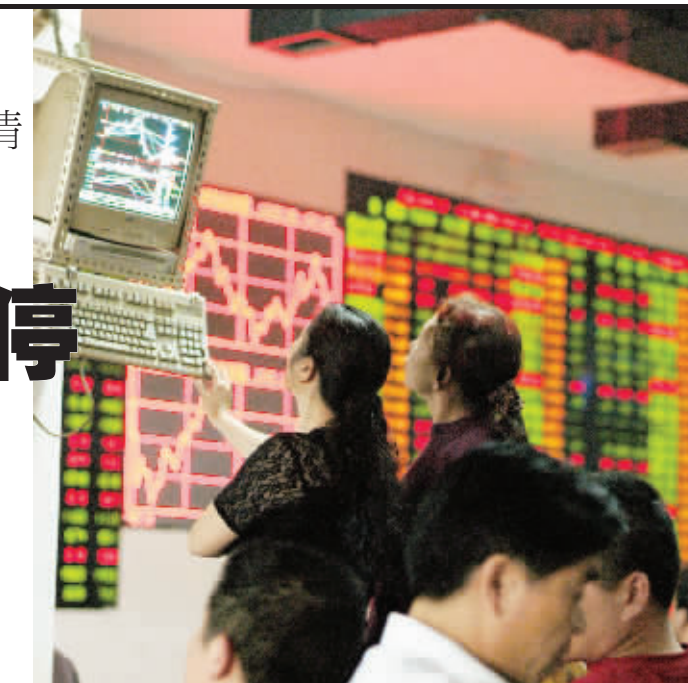
在阳线的照耀下,周一各股纷纷探头上涨。记者童迪摄

当日出现在沪深涨幅榜前列的股票大多为中低价股。在涨停的25只股票中,仅有6只股票价格高于15元,而低于10元的股票则多达10只。而涨停的华升股份、湖南海利分别收于4.91元和6.60元。从涨停的两只湘股基本面来看,都属于不折不扣的“垃圾股”,两只股票一季度的每股收益均不足