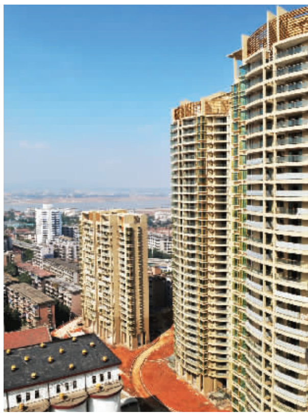
全省商品房空置现象依然严重。

今年下半年及今后一两年内,国土资源管理部门将尽快出台土地闲置处置方案,盘活闲置地和违规用地的同时,也积极拓展房地产用地供应渠道。