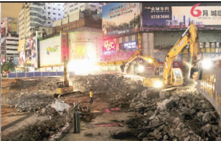
昔日繁华的五一广场(左),7月10日起,开始全封闭施工。