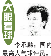
李承鹏：国内最高人气球评员。