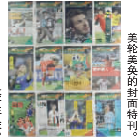
美轮美奂的封面特刊。