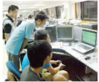
演练一下当晚的比赛。