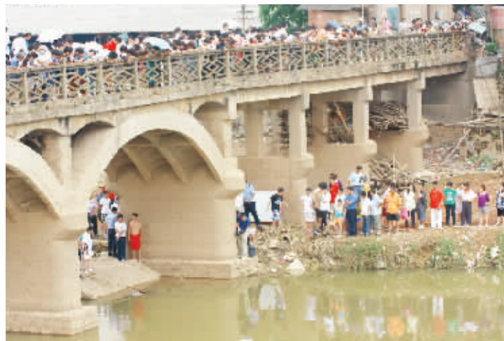
7月7日上午,长沙市咸嘉湖附近河段发现一具女尸,这引得数百名群众围观。

随后,男子被警察带到派出所进一步了解详情。截至发稿时,警方称老人身亡已排除他杀的可能,但仍在调查。