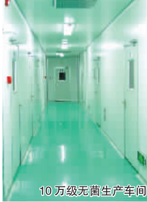
10万级无菌生产车间

经香港、澳门、北京、上海等地的众多患者服用:风之消治痛风有特效,愈后不易复发,并且无副作用,其安全性可与食品同级。