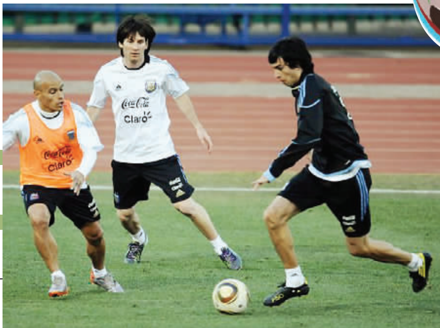
梅西近来状态不错，但感冒让他出场前景成疑。