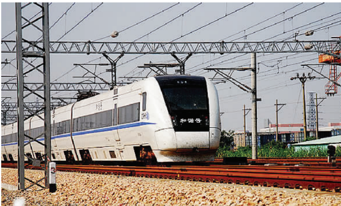
城铁从方方面面正在改变我们的生活。

上述业内人士建议,有刚性需求且有支付能力的市民早买房早受益,投资型的市民如有房贷压力则需谨慎。