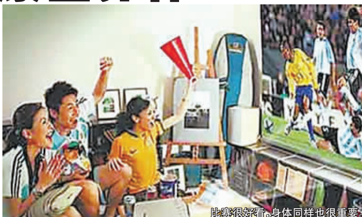
比赛很好看，身体同样也很重要。

专家建议： 看球赛姿势要正确，最好平视，不能昂头或低头长时间观看；人多或在酒吧，必须侧着身体、偏着头看球赛时，角度不能超过15度；中途有时间，上个厕所，左右转动脖子，促进血液循环。