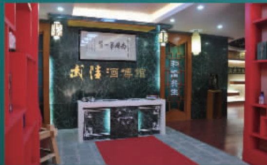
湖南首家专业性酒博物馆