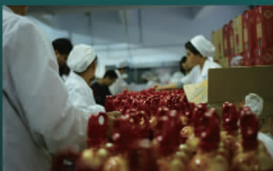
机械化包装生产线