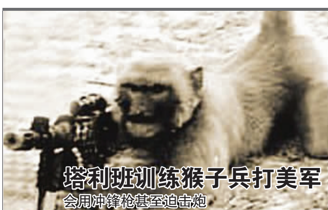
塔利班训练猴子兵打美军 会用冲锋枪甚至迫击炮

据英国媒体27日报道，阿富汗的塔利班军阀们竟想出了一种匪夷所思的方法对付驻阿盟军：他们竟将一些猴子训练成了“致命杀手”，教会了这些猴子如何使用卡拉什尼科夫冲锋枪、布伦式轻机枪甚至迫击炮，并教它们如何专门向穿美军服装的士兵发起袭击。塔利班武装分子会通过一系列“奖惩办法”逐步教会它们如何使用致命的武器。比如说香蕉和花生奖励那些学会打枪的猴子。颇具讽刺意味的是，“训练猴子当杀手”的主意最早却是由美国中情局发明出来的，美国中情局曾在越战中发起“香蕉行动”，专门用花生和香蕉当奖品，训练一些“猴子士兵”在丛林中猎杀越南士兵。