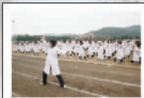
运动会太极拳表演