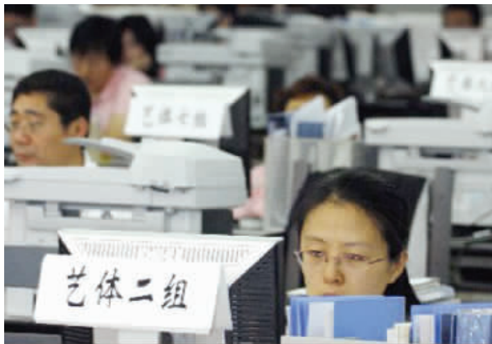
网上录取工作人员进行网上操作。(资料图片)

(6)邮寄录取通知书及有关资料。招生学校完成录取后,省教育考试院核准形成录取考生数据库,并据此打印相应录取考生名册以及民办本科院校的《录取考生信息确认表》,作为考生被高校正式录取的依据,予以备案。高校根据省教育考试院核准备案的录取新生名册填写考生录取通知书,加盖本校校章,并负责将考生录取通知书连同有关入学报到须知、资助政策办法等相关材料(民办本科院校还须附加省教育考试院出具的《录取考生信息确认表》)一并直接寄送被录取考生。未加盖“湖南省普通高等学校招生委员会录取专用章”的录取新生名册一律无效。