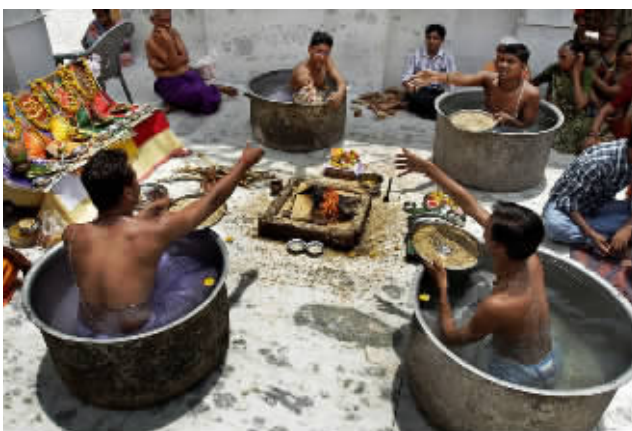
在印度阿默达巴德举行的一场祈雨仪式，几名男子坐在水盆里祈求雨季到来。