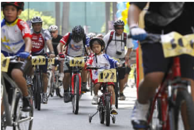
菲律宾马尼拉举行了一场父亲节父子骑车的活动。一名小男孩在比赛中骑着辆带平衡轮的自行车。

——马拉多纳神，照耀南非天空。PS.以上言论系女球迷贿赂排字工人，以上观点与本报无关。