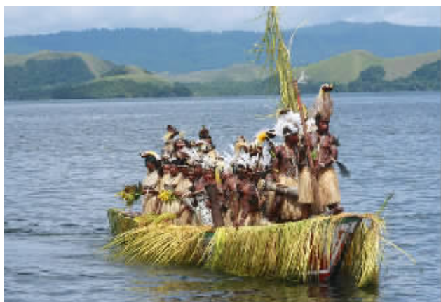
印尼巴布亚省，巴布亚部落的土著身着战衣搭乘礼船庆祝一年一度的斯塔尼湖节。