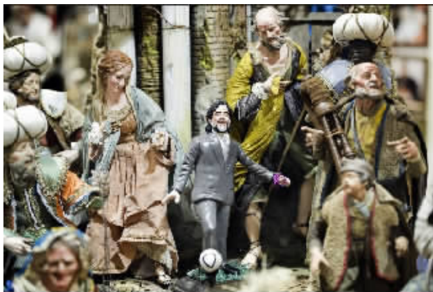
意大利那不勒斯，一尊表现马拉多纳踢球的泥塑出现在典型的那不勒斯工艺品商店中。

——马拉多纳神，照耀南非天空。PS.以上言论系女球迷贿赂排字工人，以上观点与本报无关。