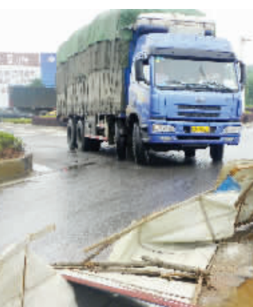
6月24日,雨花区万家丽路与环保路口,由于红绿灯坏了,路口经常发生车祸。