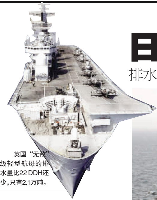
英国“无敌”级轻型航母的排水量比22 DDH还少,只有2.1万吨。