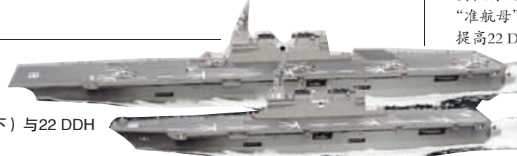
日本日向级直升机母舰(图下)与22 DDH(图上)的体积比较想象图。

英国“无敌”级航母标准排水量19500吨,满载排水量21000吨;舰长206.6米,宽27.5米,吃水7.3米;总功率11.2万马力,最大航速28节。无敌级航母飞行甲板长167.8米,宽13.4米,可搭载9架“鹞式”战斗机,3架“海王”式空中预警直升机和9架“海王”式反潜直升机。英国皇家海军现役“无敌”级航母共有三艘:“无敌”号、“卓越”号和“皇家方舟”号。“无敌”号服役不久,便参加了英、阿马岛海战。实战表明,该级舰具有作战灵活和一定的制海能力,在局部海上冲突中发挥了重要作用。