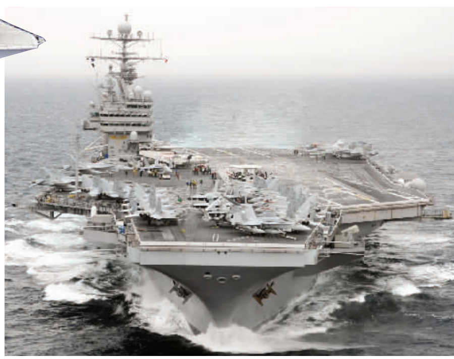
美国海军现役罗斯福号航空母舰。