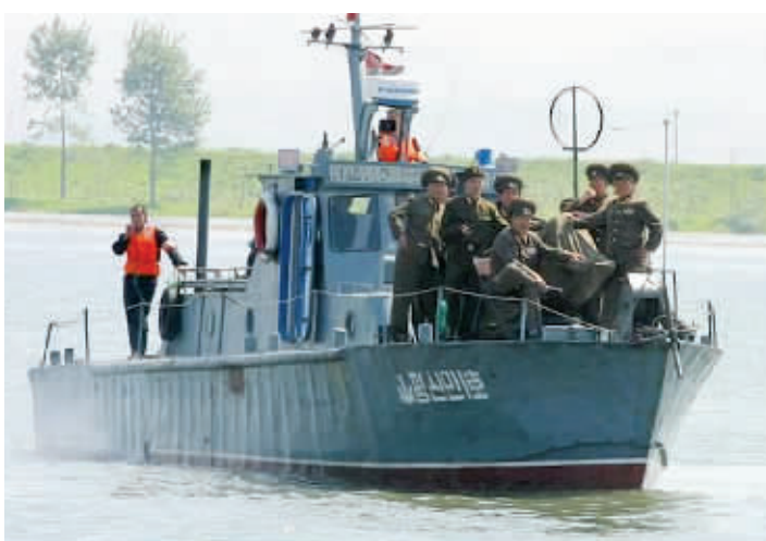
朝鲜人民军巡逻艇 (资料图片)

就在朝鲜南方边界上与韩国的对峙不断加剧之际，韩日媒体7日突然大量报道朝鲜北方边界“响起的枪声”，称朝鲜边防军在鸭绿江枪击中国走私船，有人人员伤亡。中国外交部发言人秦刚在今日举行的例行记者会上证实，6月4日凌晨，辽宁省丹东市居民因涉嫌越境从事边贸活动遭到朝鲜边防部队枪击，造成3人死亡，1人受伤。