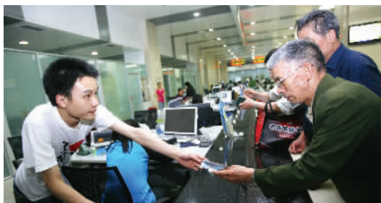
6月8日,长沙市政府政务服务中心,65岁至69岁之间的老人,在办理新版老年人优待证(老年证)。

为了防止老人们排队时引起身体不适,政务中心空出了大部分的座椅,“但这也只能解决小部分的问题,一个上午来办理证件的老人有五六百个,根本不能全部照顾到。”工作人员也对这样的情况表示无可奈何,“其实,办理新证并没有截止时间,如果不急用可以避开高峰期前来办理。”