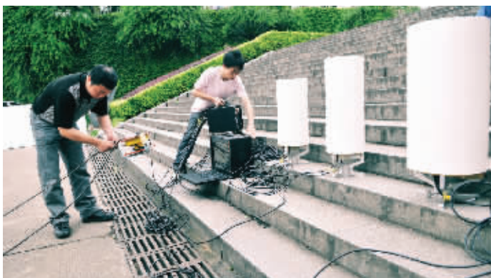
6月7日上午,湖南师大附中考场,长沙市无线电管理处的技术人员守候在考场附近侦测作弊信号。

针对流动车辆作弊、信号时有时无的特点,长沙市无线电管理处专门出动了宽带多信号干扰仪。这小家伙不简单,有着最大50瓦的功率。“也就是说,如果将它放在岳麓山上,可以压制住长沙市内所有的非法信号。”潘建军介绍,这个仪器最大的特点就是能压制信号。如果能找出作