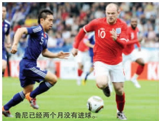
鲁尼已经两个月没有进球。

距离南非世界杯开幕只剩不到两周的时间，两支曾捧起大力神杯的球队——法国队和英格兰队在热身赛上踢得却不轻松。北京时间5月31日凌晨，法国队下半场进球，最终与突尼斯队1:1战平；此前英格兰队则在先失1球的情况凭借两记乌龙，才以2:1攻下日本队。