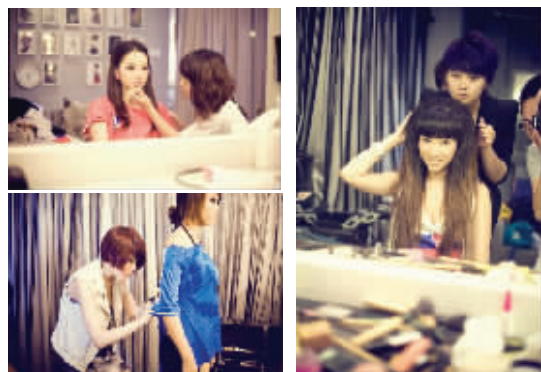
本组图片均为拍摄花絮。