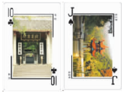
湖大校园景点扑克牌之岳麓书院(左),师大校园景点扑克牌之岳亭。

“我们先以湖大、湖南师大为试点,等积累了一定的资金和经验后,再好好地给中南大学做一套宣传扑克,最后扩大到整个湖南的大学。”4个人最先开始是取景,联系专业人员摄影。景点定好,几个学生又开始张罗找印刷厂家。经过几百个印刷厂的筛选,他们联系上山东一家扑克厂,印刷湖南大学和湖南师范大学各5000副扑克牌。