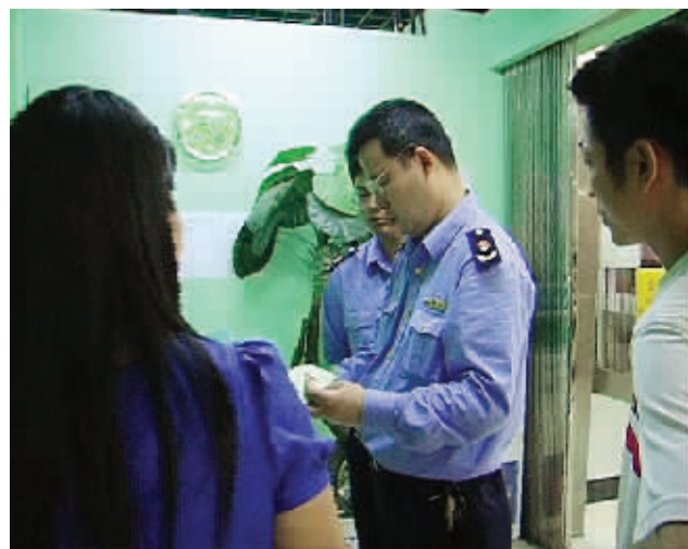
工商执法人员对该店做出了责令停业的决定。