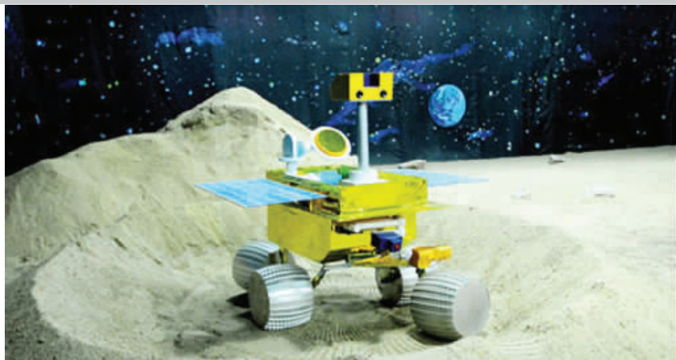
湖南大学开发的四轮菱形月球车。