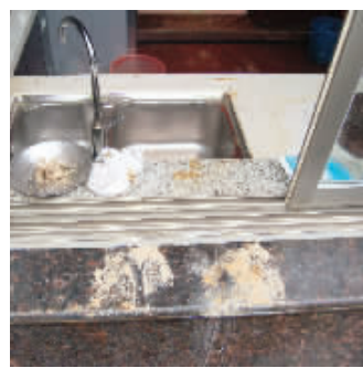
犯罪嫌疑人在盗窃现场留下的脚印。

“一辆黑色奇瑞小车,总是出现在案发地点。”嫌疑人流窜作案,应该具备交通工具。通过调看道路监控录像及