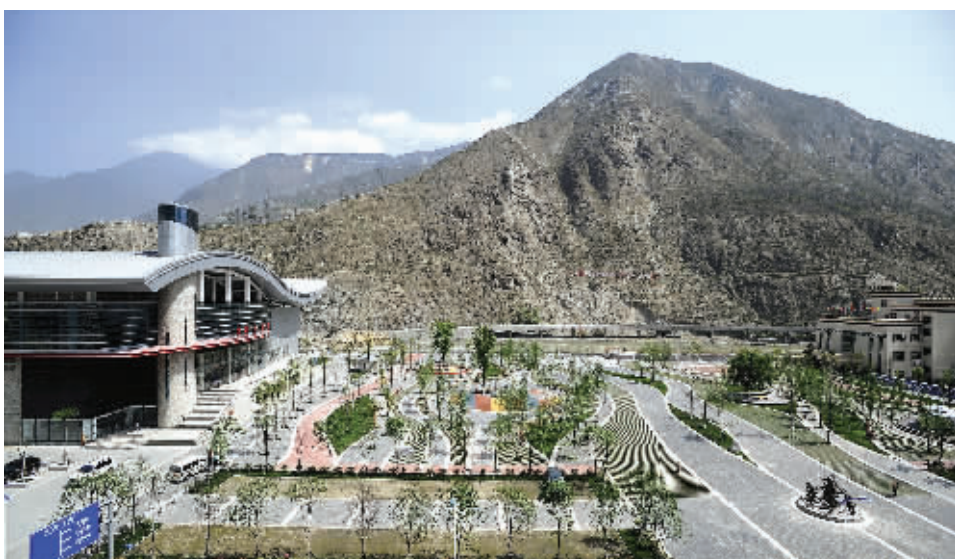
四川震后重建加强城镇避灾广场建设。这是汶川县体育馆旁边一个占地面积2万多平方米的避灾广场(5月5日摄)。