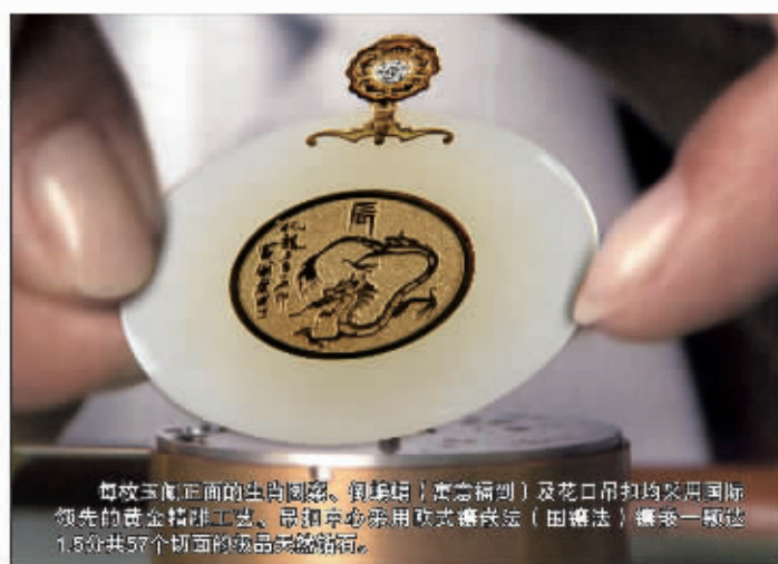
每枚玉佩正面的生肖图案、镶嵌(黄金精制)及花口吊扣均采用国际领先的黄金精加工工艺、最顶尖的采用欧式镶嵌法(田磨法)镶嵌一颗达1.5分共57个切面的极品美钻。

【珠宝聚焦】 作为世界顶级珠宝的领航者，Swiss greatwise 一直提倡珠宝与文化的结合。正像格瑞的品牌哲学“ Our job, to be in love with culture ”(我们的天职，是热爱对文化的挚爱)所表达的那样，这套中国概念的珠宝杰作展示了奢华的国际珠宝艺术与5000年源远流长的中国文化的结合。格瑞致力于表现珠宝的文化品味，并以此显示了对时尚珠宝界形式主义美学的挑战!格瑞的珠宝永远是既精美无比，又寓意深远!