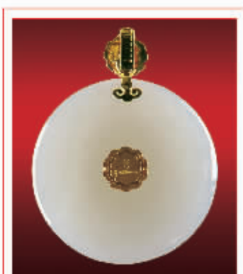
★玉佩背面中间为黄金雕刻的格瑞标识，彰显出品牌的辨识度。 ★玉佩背面和正面的黄金部分(上端及中心部分)全年采用以针点焊接，坚固不松动。 ★玉佩的每件玉面全部采用微磨或抛光工艺，极具和田玉温润与油性。 ★每枚玉佩均经过20多道程序的品质检测，并出具具有国际权威认证的《品质保证证书》。

在中国文化中，玉是沟通天地间的灵物，古人甚至“以玉比德”，所谓“君子无故，玉不离身”。这套金