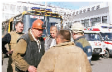
5月9日,煤矿的行政大楼外,矿工和救援人员在交谈。