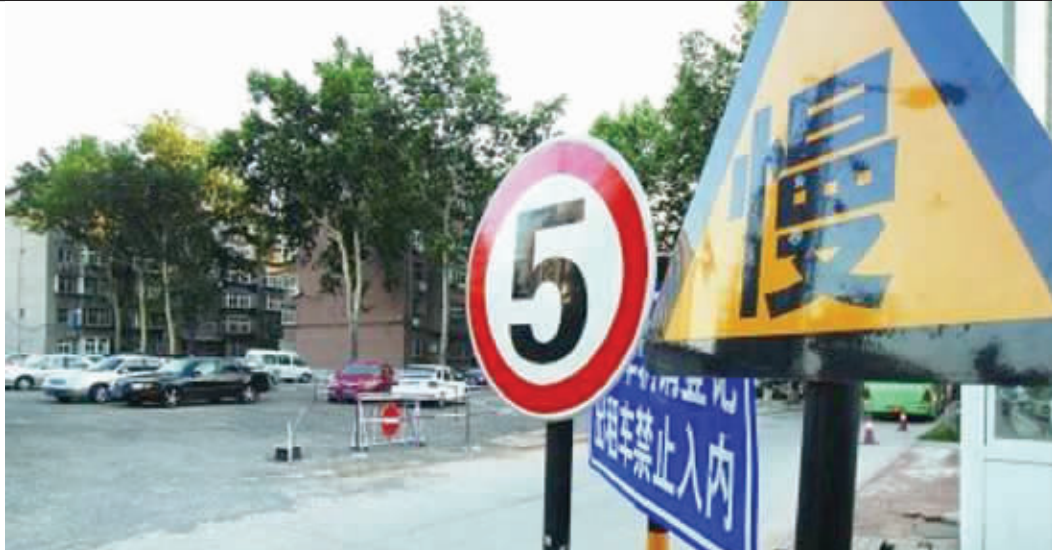
不少小区内的5公里限速牌基本上都成了“摆设”。

长沙邵阳华美家园小区发生撞死小孩的车祸后(详见本报4月26日A06版),事故的处理结果成了大家关注的焦点。5月4日,记者接到了死者父亲的电话,他称直到现在交警的检测结果还没出来,而肇事方打电话给他,提出要“私了”。同时,华美家园的业主反映,小区里汽车超速行驶现象普遍,许多进出小区的车辆对小区限速5公里的规定置若罔闻。一位业主说,出了这起事故后,小区里几乎人人自危,散步的人明显少了很多。