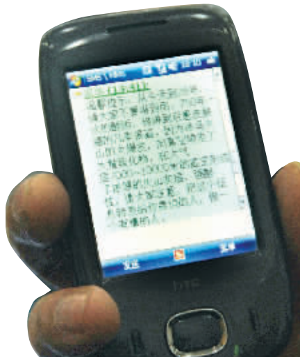
4月22日，一市民收到的有关火山灰的提醒短信。