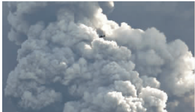
受冰岛火山喷发引起的火山烟尘。

火山灰事件之前，冰岛经历全球金融风暴，当地快速起飞的主要银行倒闭，结果导致英国和荷兰34万人的储蓄血本无归，迫使当时原是世界上最有国家之一的冰岛，不得不向国际货币基金组织求救。另一个笑话则说：“当冰岛的经济死亡时，它的最后愿望就是，将骨灰撒到全欧洲。”